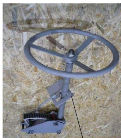
стопор в сборе